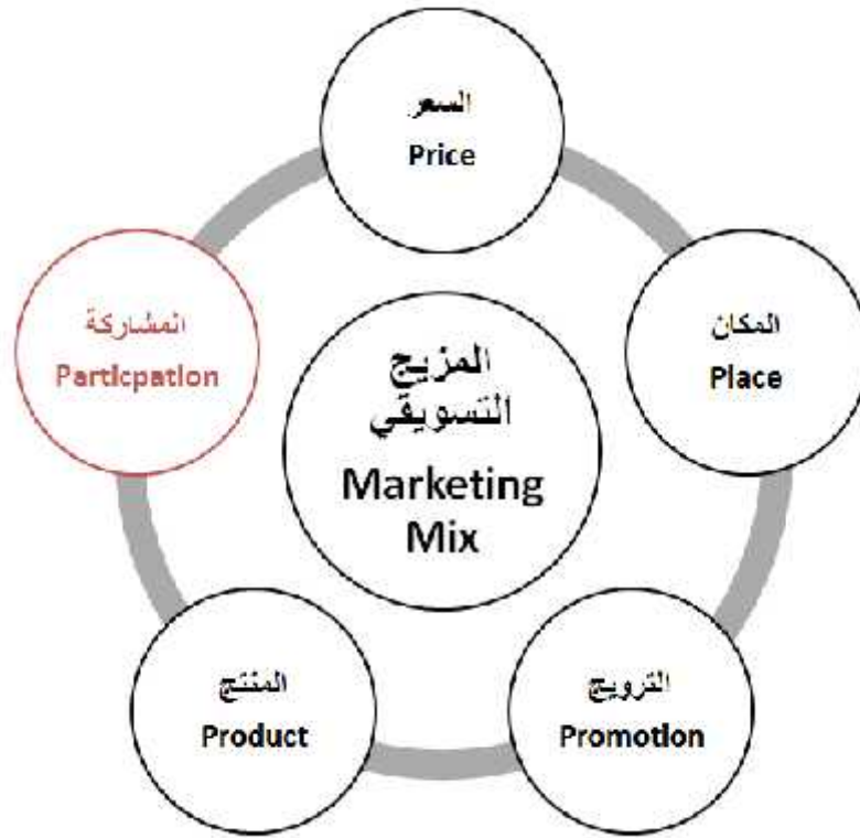
الشكل (1) يبين العناصر الأساسية في المزيج التسويقي السياحي