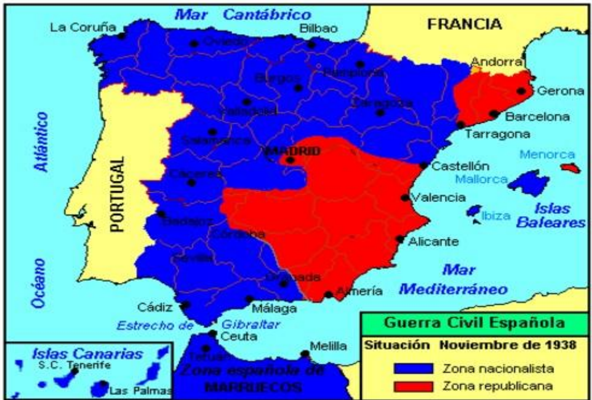
Situación de España en 1938