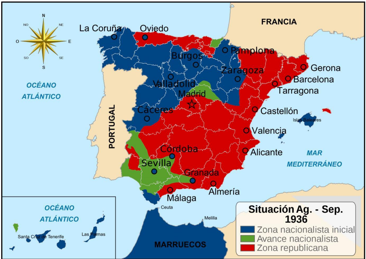
Mapa de España en los principios de la Guerra Civil