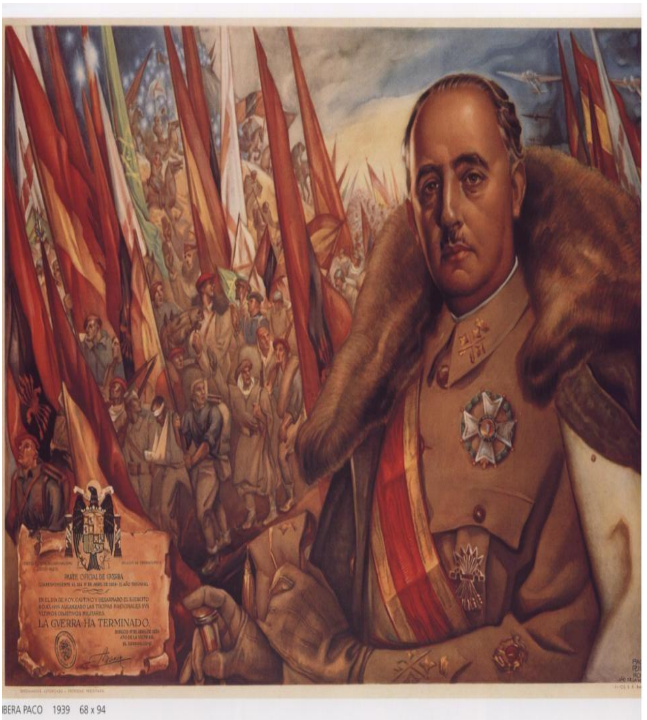
El general Francisco Franco en 1939