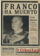
Revelación de la muerte del general Francisco Franco en los periodos