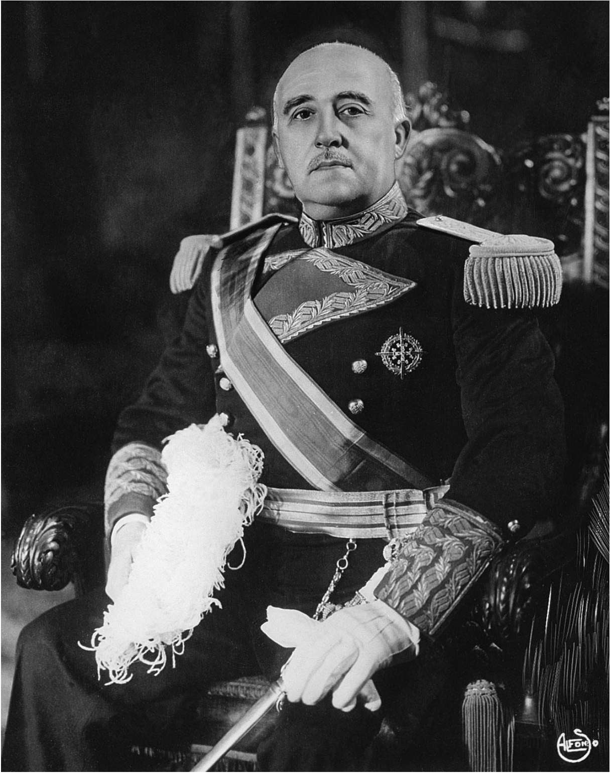
Francisco Franco en 1954