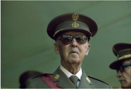
El general Francisco Franco en 1975