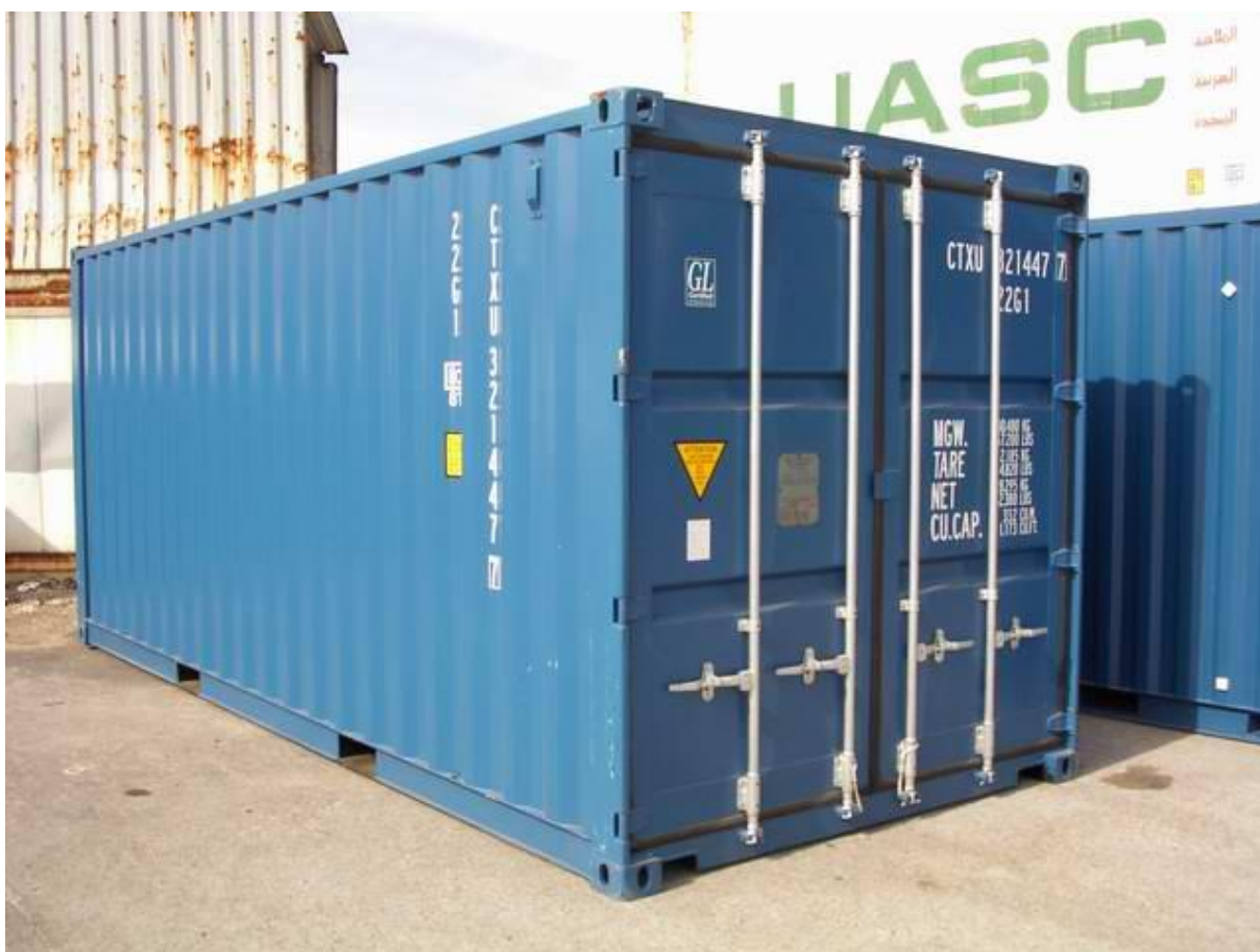
Fig. 3. Modèle de conteneur utilisé pour les stations.