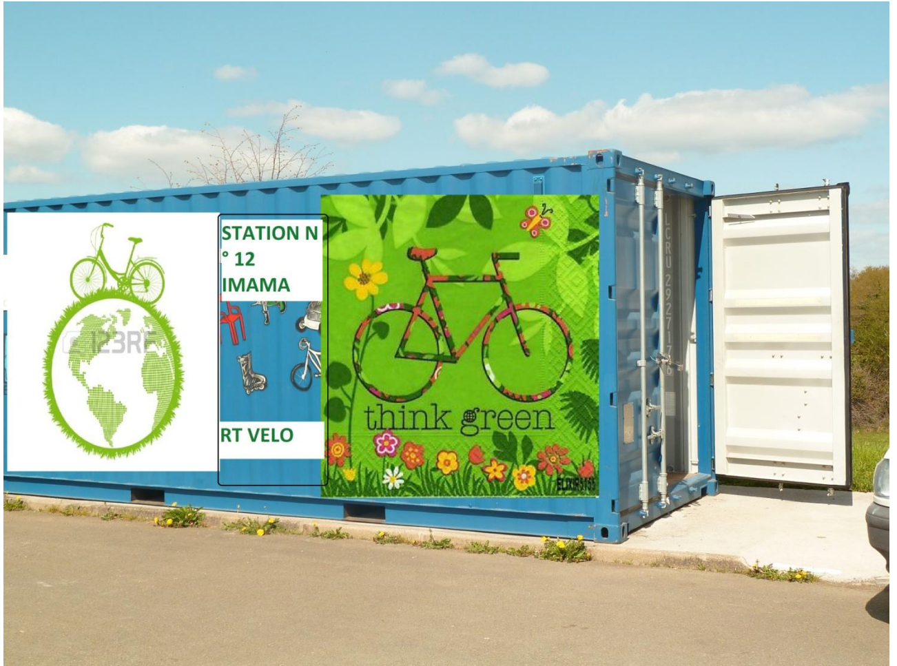
Fig. 4. Type de décoration possible des conteneurs.