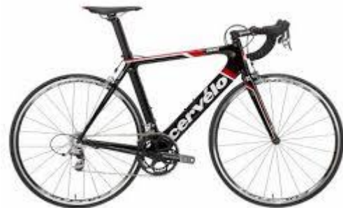
Fig. 1 : Modèles de vélos.