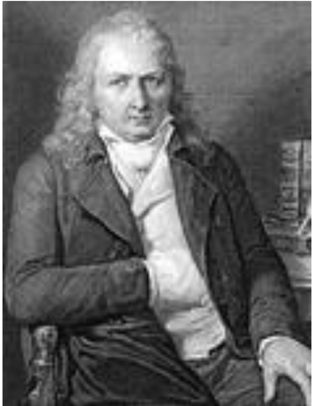
JACQUES HENRI BERNARDIN DE SAINT-PIERRE (1737-1814)