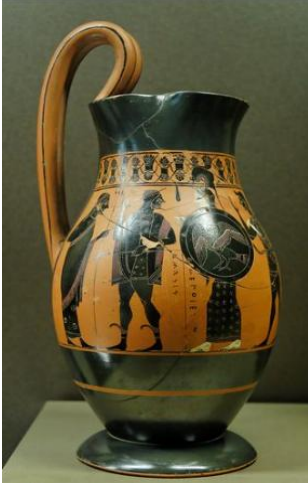
صورة رقم 01 : إبريق نبيذ بزخرفة الشخصيات السوداء من عمل الرسام أماسيس، يصور هرقل وأثينا، حوالي عام 540 قبل الميلاد، متحف اللوفر 1 .

الأباريق والأواني التي زينها الرسام أماسيس تتميز بالتصوير الحيوي والتفاصيل الغنية التي تعكس الأساطير اليونانية والشخصيات البطولية. تصوير هرقل وأثينا على هذا الإبريق يعكس أهمية الأساطير في الثقافة اليونانية، حيث كان هرقل رمزاً للقوة والشجاعة، وكانت أثينا رمزاً للحكمة والحرب العادلة. هذه الموضوعات الأسطورية لم تكن مجرد زينة، بل كانت تعبيراً عن القيم والمعتقدات السائدة في المجتمع اليوناني القديم. الفن التشكيلي في هذه الحقبة لم يكن مجرد تعبير جمالي، بل كان يحمل دلالات ثقافية واجتماعية ودينية. الأواني المزخرفة بالشخصيات السوداء كانت تستخدم في الحياة اليومية وكذلك في الطقوس الدينية، مما يعكس تداخل الفن مع الحياة اليومية والدين في الثقافة اليونانية. إبريق النبيذ من عمل الرسام أماسيس، المعروض في متحف اللوفر، يعد مثالاً ممتازاً على قدرة الفنانين الإغريق على الجمع بين الجمالية الفنية والوظيفة العملية، مما يساهم في فهم أعمق للحضارة اليونانية القديمة وتقدير فنها الراقي