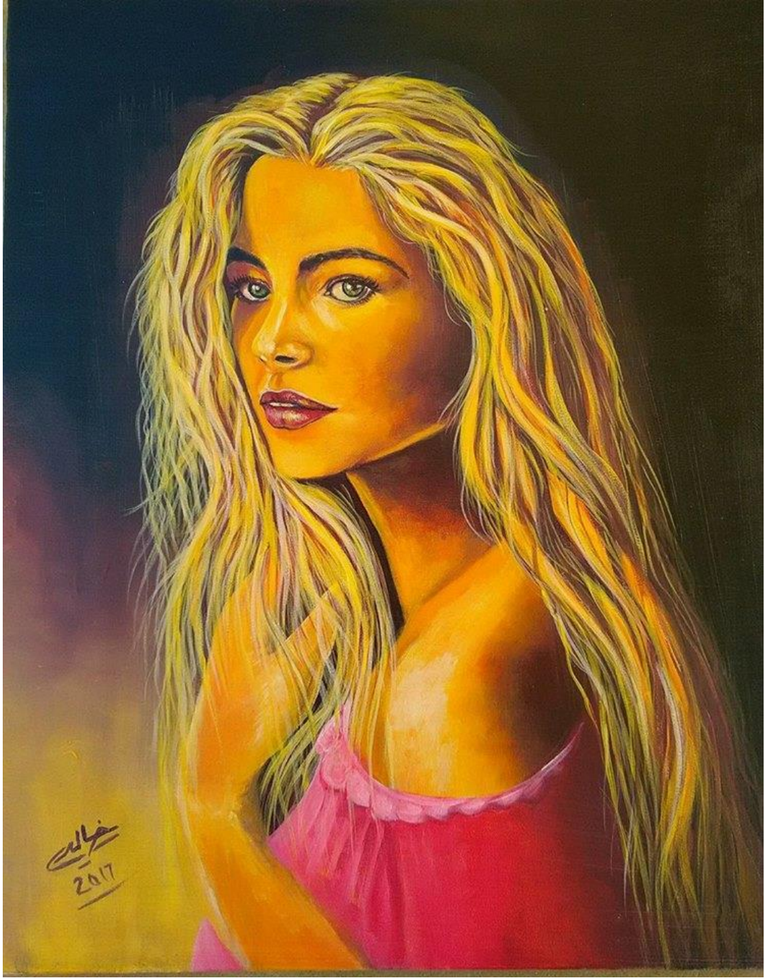
عنوان اللوحة : الخنساء