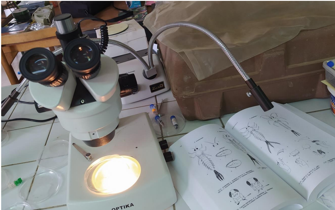
Figure 4: Loupe binoculaire et la clé de Techet,2010