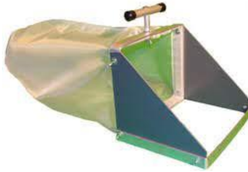
Figure 3 :Le filet surber