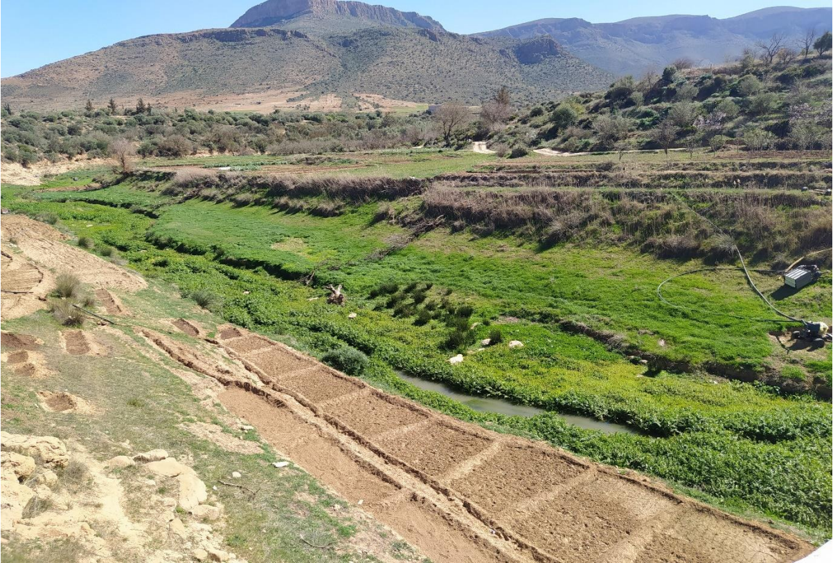
Figure 2: Station K2