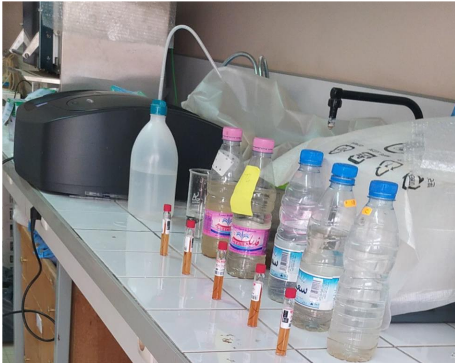
Figure 5: analyse chimique de l'eau échantillonnée au laboratoire