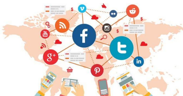
Figura2. Imagen de Redes sociales en internet