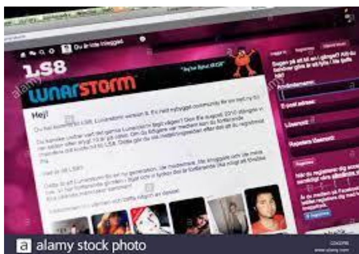
Figura 1. Imagen de la Web LunarStom

Creadas en 2000 y 2001 respectivamente. LunarStorm Fue creada por Rickard Ericsson como la primera comunidad en línea de Europa. Junto a CyWorld se rediseñaron para empezar a agregar funciones propias de red social como listas de amigos, libros de visita y páginas personales.