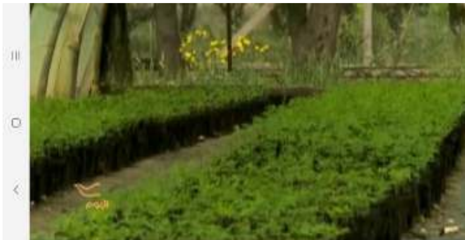
Photo 08: Pépinière de Moringa (Pépinière de M. EL MENSI Ahmed – TUNIS- photos capturé d'une émission télévisé le 20/08/2020)

Le stress de la transplantation pourra être réduit en plantant le plant avec son sac (coupé dans le fond et sur les côtés) ou avec sa motte si c'est possible. Le plan devra être convenablement arrosé si le repiquage est effectué en période sèche pour favoriser un développement racinaire précoce. Dans les climats secs et arides, un apport d'eau régulier sera nécessaire les deux premiers mois suivant la transplantation.