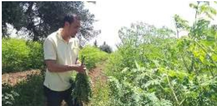
Photo 11: La récolte manuelle de Moringa oleifera