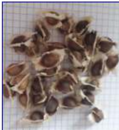
Photo 05 : les graines de Moringa oleifera Lam. (Photo originale prise le 25/05/2020).

Un arbre peut produire entre 15000 à 25000 graines par an (FOIDL et al., 2001).