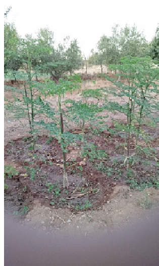
Photo 23: Plantation de 3 mois de Moringa oleifera à Seb Dou (Originale)