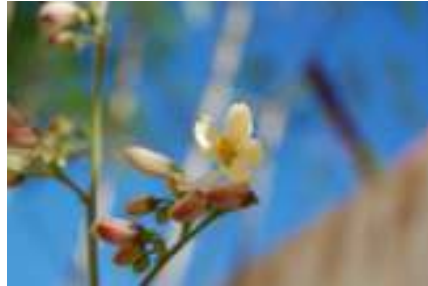
Photo 03 : fleurs de Moringa oleifera Lam..

Les fleurs mesurent 2.5 cm de large et se présentent sous forme de panicules axillaires de 10 à 25 cm. Elles sont blanches ou couleur crème, avec des points jaunes à la base dégagent une odeur agréable (FOIDL et al., 2001).