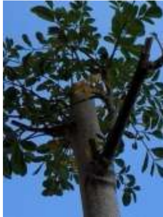
Photo 01 : Tronc d'un arbre de Moringa oleifera Lam. (Photo prise par M.TAHRAOUI en 2015).