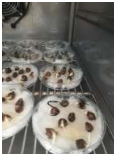
Photo 16: Tests de germination des graines de Moringa au laboratoire (photo originale prise le 20/03/2020)