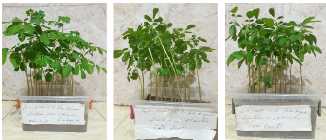
Photo22 – Test de germination des graines de Moringa oleifera (sol de Seb Dou)

Taux de germination est de 99 % (Originale)