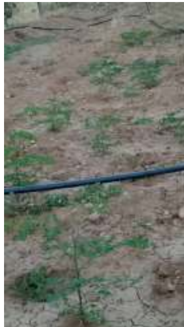
Photo 17: le Moringa après 1 mois de la plantation dans la région de Sebdo (photo originale)