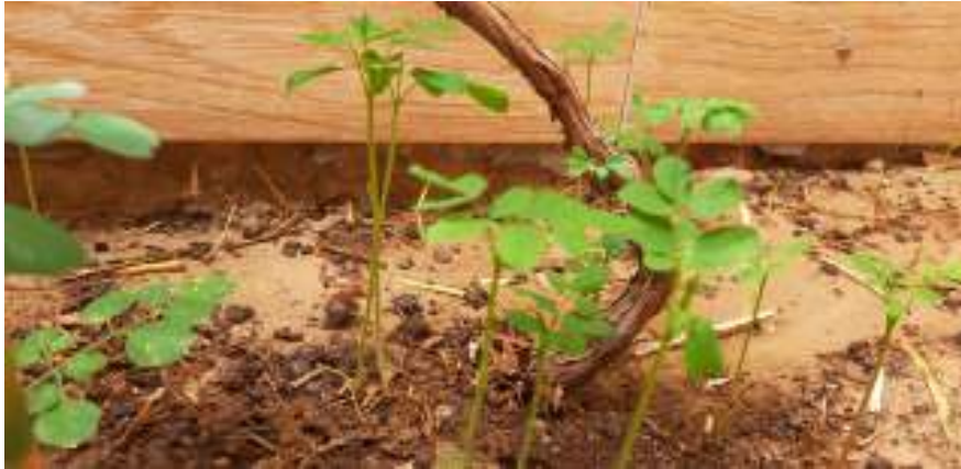
Photo 07: Semis intensif de Moringa oleifera (photos originale prise le 20/8/2020, 9 jours après le semis)

Lorsque pour des raisons diverses, pour pratique par exemple des cultures associées, la transplantation est préférée, cette opération intervient environ un mois après le semis.