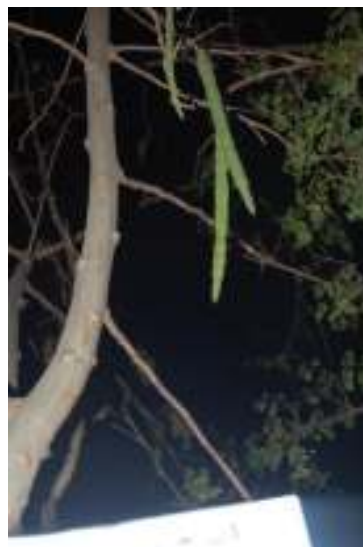
Photo 04 : fruits de Moringa oleifera Lam. (Photo prise par M.TAHRAOUI en 2015).

Ils contiennent en moyenne 10 à 30 graines rondes qui sont libérées à sur-maturité par la déhiscence.