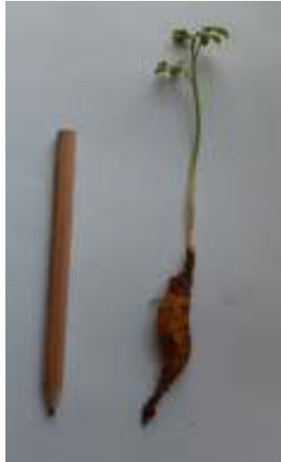
Photo 06 : les racines de Moringa oleifera Lam. (Photo originale prise le 09/08/2020).