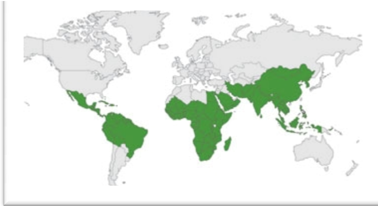
Fig. 01 : répartition de Moringa dans le monde.

Moringa oleifera encore appelé « arbre de la vie » est une plante de la famille