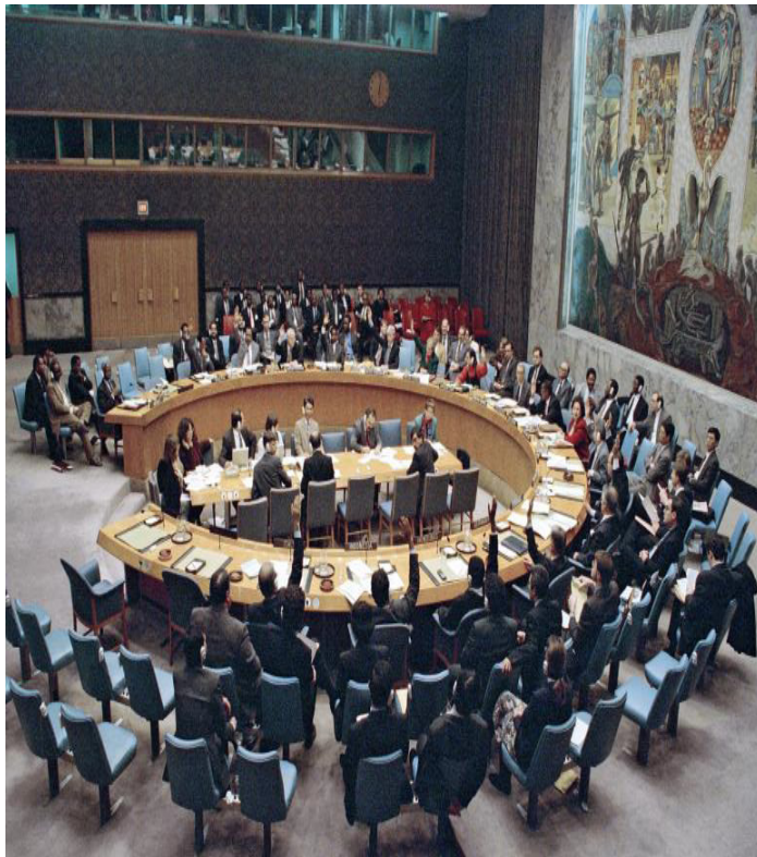
Security Council 1995

In April 1995, the five NPT nuclear-weapon states provided pledges on NSAs to non-nuclear-weapon States parties of the NPT. These unilateral declarations were reflected in Security Council resolution 984 (1995), which also welcomed the intention of certain States that they would support and provide assistance to any non-nuclear-weapon State that became a victim or was threatened by acts of aggression in which nuclear weapons were used, so-called “positive security assurances.” These unilateral commitments were a part of efforts to obtain the indefinite extension of