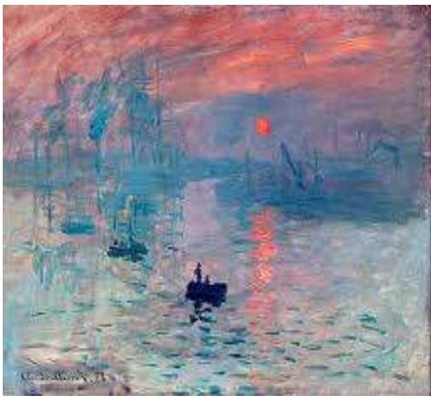
انطباع شروق الشمس - للفنان - كلود-مونييه 2

أيا يكن التفسير الصحيح والمقصد من وراء اللوحة، تبقى ألوان ادوارد مانيه روعة حين ننظر إليها، وتظل لوحاته تتصدر قمة اللوحات العالمية والمدرسة