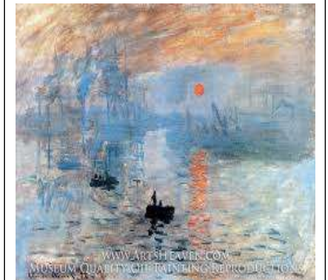
انطباع شروق الشمس - للفنان - كلود-مونييه 1