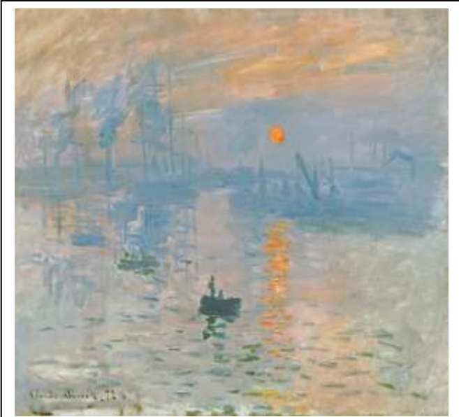
انطباع شروق الشمس - للفنان - كلود-مونييه4