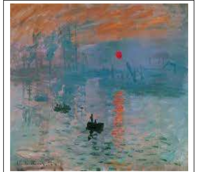
انطباع شروق الشمس - للفنان - كلود-مونييه3