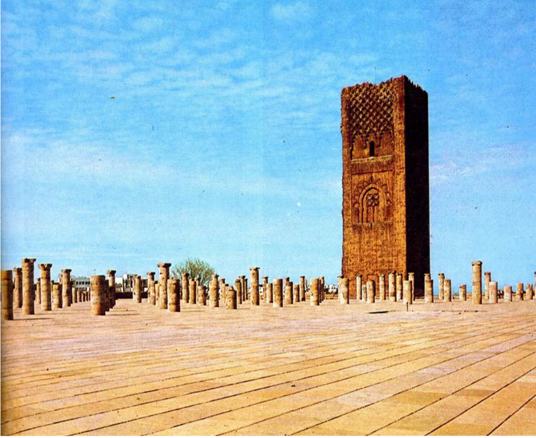
صومعة حسان بالرباط

- طه الولي، المساجد في الإسلام ، ط1، دار العلم للملايين، بيروت، 1988، ص114