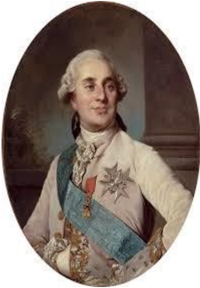
4. Luis XVI