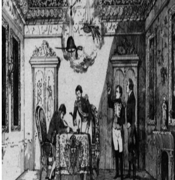
13. Tratado de Fontainebleau