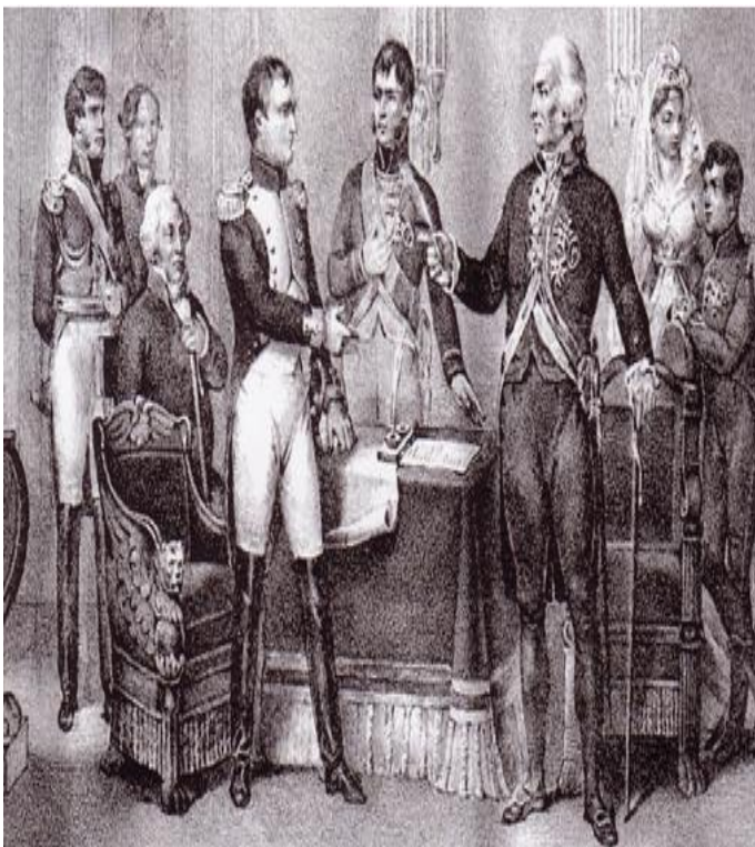
14. Abdicaciones de Bayona (constitucionweb.blogspot.com)