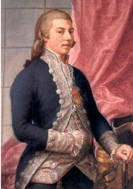
12. Manuel Godoy por Bayeu