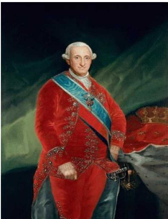
6. Carlos IV de España por Francisco Goya