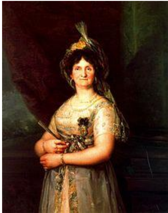
9. Retrato de la Reina María Luisa por Vicente López en 1816