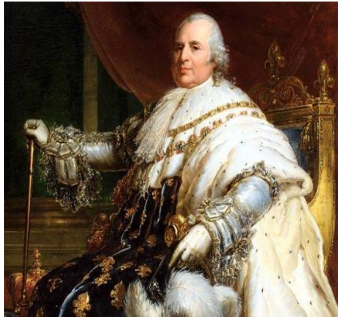
5. Luis XVIII (biografiasyvidas.com)