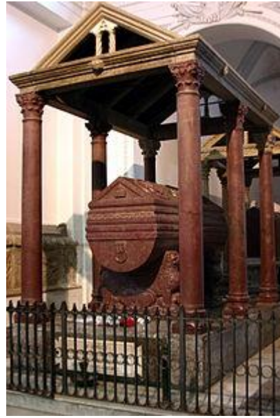
Sarcófago de Federico II Catedral de Palermo.